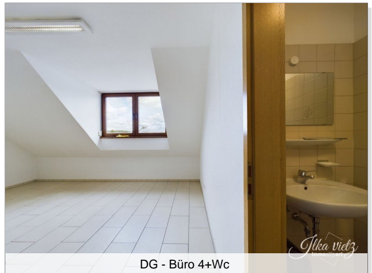
DG - Büro 4+Wc