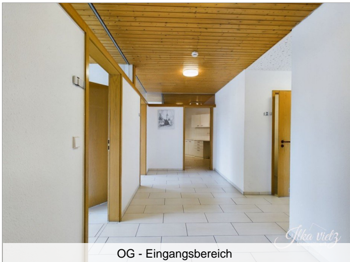
OG - Eingangsbereich