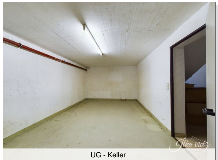
UG - Keller