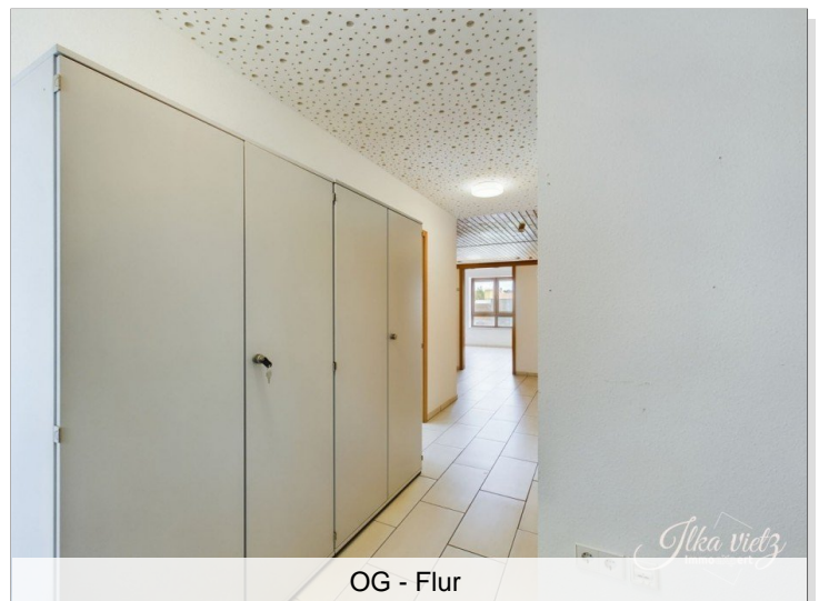
OG - Flur