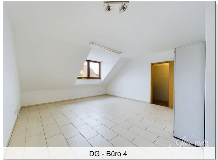
DG - Büro 4