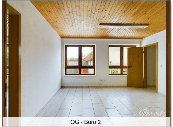
OG - Büro 2