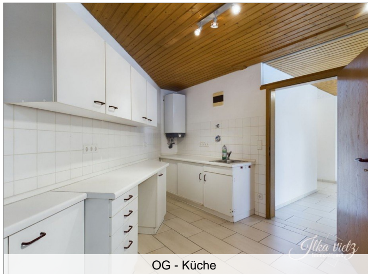
OG - Küche