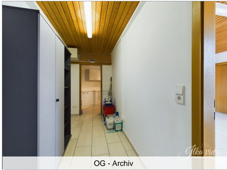
OG - Archiv