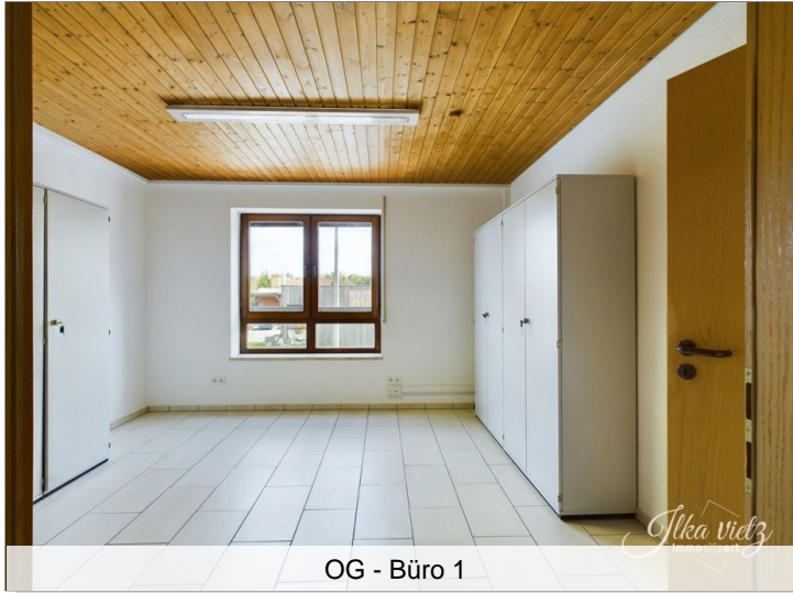
OG - Büro 1