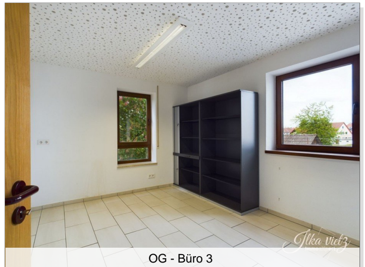
OG - Büro 3