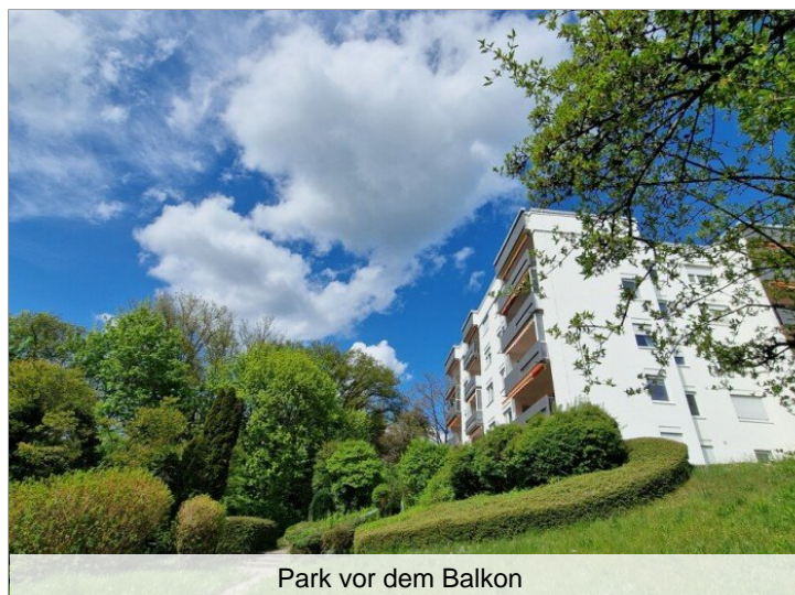
Park vor dem Balkon