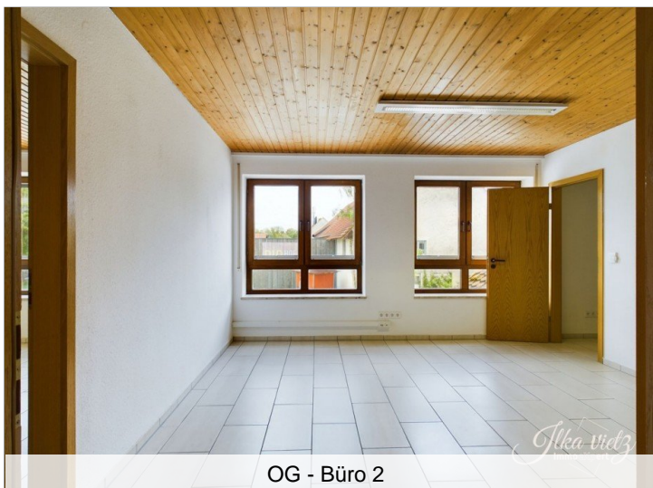
OG - Büro 2