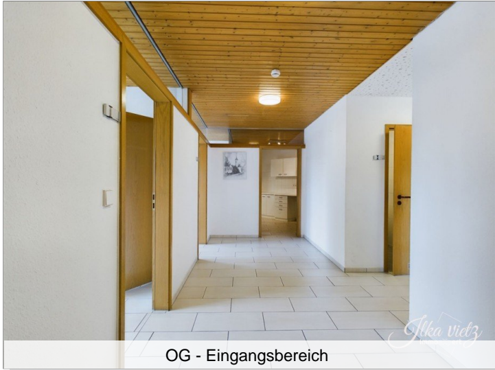
OG - Eingangsbereich