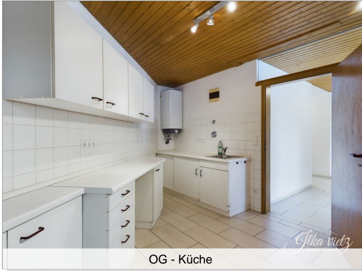
OG - Küche