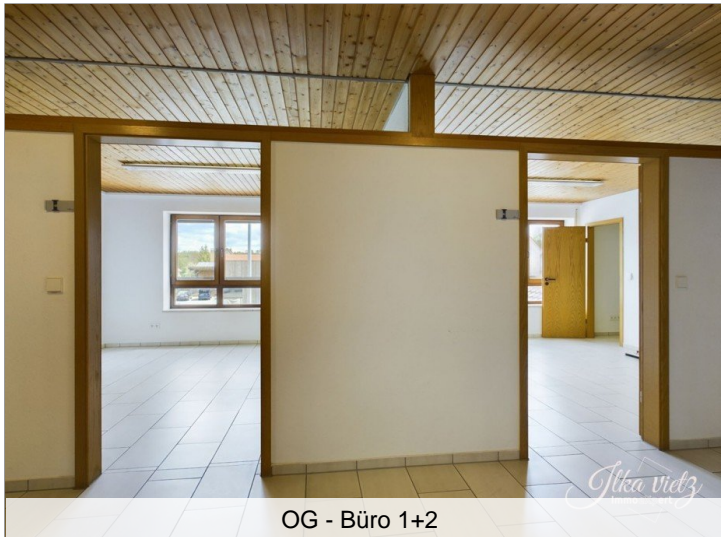
OG - Büro 1+2