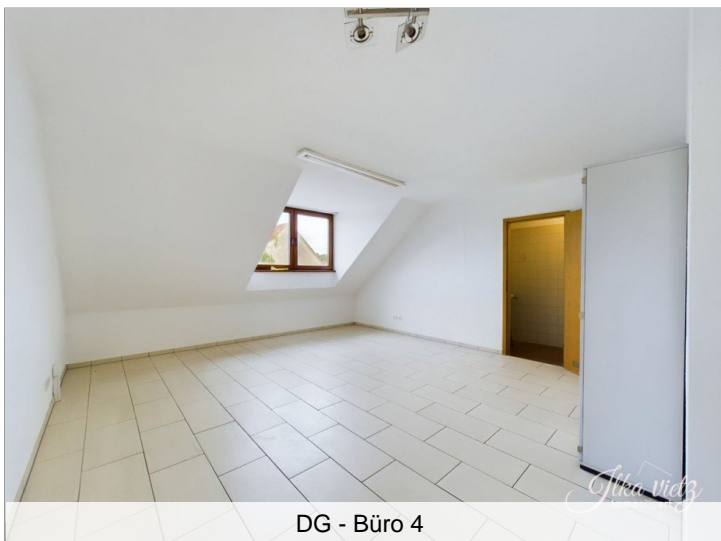
DG - Büro 4