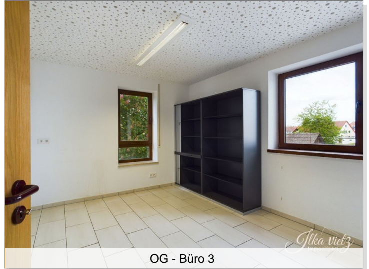
OG - Büro 3