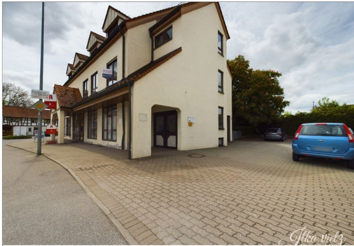
EG - Aussenansicht