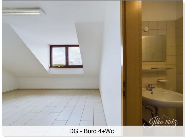
DG - Büro 4+Wc