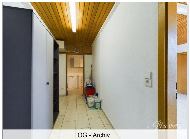
OG - Archiv