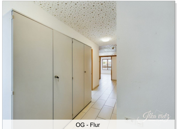
OG - Flur