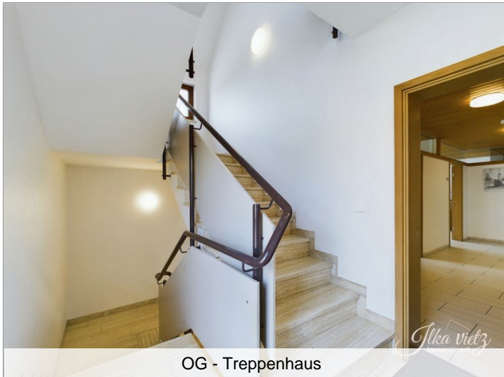
OG - Treppenhaus