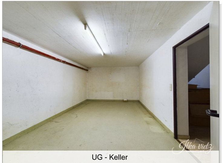
UG - Keller